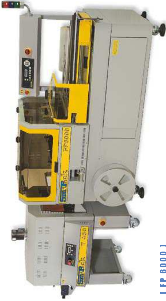
I FP 6000 I